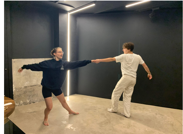
Tournage de la danse