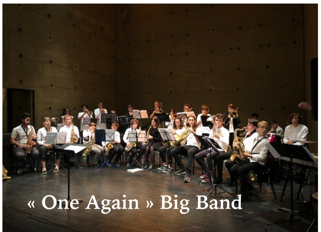
« One Again » Big Band

L'Orchestre Petites Mains Symphoniques c'est également des projets internationaux d'envergure. En effet, depuis 7 années, les musiciens de l'Orchestre représentent la France au Festival d'Iguazú en Argentine, festival qui réunit 800 enfants des 5 continents. L'association est également invitée à se produire dans 26 pays.