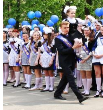
Image 9. Le dernier jour d'études.