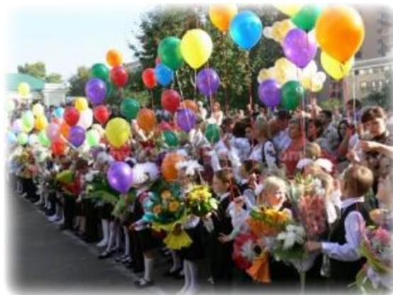
Image 4. La fête du 1 septembre.

Chaque année le 1 septembre est appelé « le jour de la connaissance » et est fêté, d'abord à l'école, et puis à la maison. À l'école, la fête est préparée par les professeurs et les élèves qui accueillent chaleureusement les nouveaux rentrants, ceux qui commencent leur étude pour la première fois. Tous les élèves (de tous les niveaux) se retrouvent devant le bâtiment. Ce qui m'a étonné, c'est que toutes les petites filles ont des bandelettes dans leurs cheveux. Le directeur de l'école (chez nous-le proviseur) tient un discours de bienvenue, puis, certains professeurs ainsi que certains élèves interviennent avec leurs petits discours. À la fin, il y a un concert préparé par les élèves (image 4). Les élèves offrent des bouquets de fleurs à leurs professeurs. Des cartes postales sont aussi dédiées à cet effet (image 5).