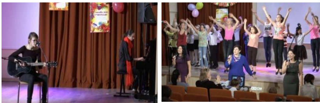
Image 10. Le 7 octobre- jour des professeurs.

Un autre exemple : la fête mondiale de la paix (le 21 septembre). Un atelier a été organisé pour sensibiliser les élèves à l'importance de la paix dans le monde entier (image 11).