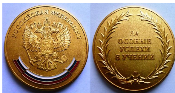
Image 3. Médaille d'or

Lors de l'obtention du BAC, les élèves, ayant « 5 » dans toutes les matières, sont récompensés par une médaille d'or (image 3).