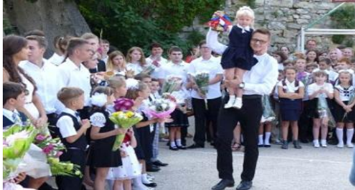
Image 8. La dernière cloche.