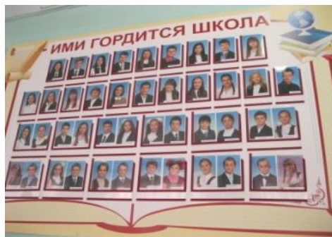
Image 2. Tableau d'honneur.

Lors de l'obtention du BAC, les élèves, ayant « 5 » dans toutes les matières, sont récompensés par une médaille d'or (image 3).