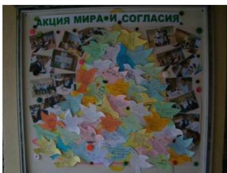
Image 11. La fête mondiale de la paix.

Un autre exemple : la fête mondiale de la paix (le 21 septembre). Un atelier a été organisé pour sensibiliser les élèves à l'importance de la paix dans le monde entier (image 11).