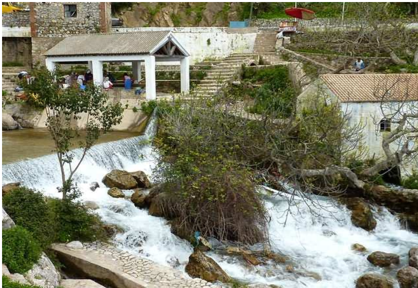
La source de Ras el Ma et le lavoir à gauche

Dès l'arrivée, on est immédiatement subjugué par la beauté de la nature qui conserve tous ses droits et cet air frais de montagne, très différent de celui de Paris ! La ville est bordée par la source de Ras el Ma où l'on peut plonger les pieds mais l'eau y est tellement glacée que l'on a l'impression que notre sang ne circule plus jusqu'à eux ! Seuls les plus téméraires se risquent à y plonger entièrement mais je ne fais heureusement ou malheureusement (cela dépend comment on voit la chose) pas partie de ces gens. Au bord de cette source se trouvent des lavoirs où les femmes viennent laver leurs vêtements. Malgré l'existence des machines à laver, cette tradition perdure car aller au lavoir n'est pas seulement une tâche à accomplir pour les femmes, c'est un rendez-vous hebdomadaire où elles peuvent discuter et se raconter les dernières nouvelles.