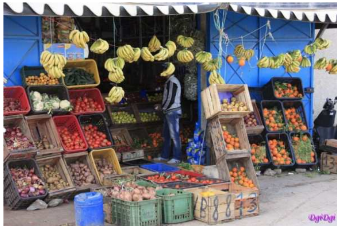
Un des nombreux étalages du souk

En continuant la promenade, on arrive au souk (le marché). Là, nous attend une explosion de saveurs et de couleurs : les allées regorgent de centaines d'épices aux couleurs et senteurs multiples. L'artisanat marocain y est bien représenté avec ces produits comme ces sacs ou ces sandales fabriqués en peau de mouton dont l'odeur particulière peut interpeller mais qui garantissent un produit unique, confectionné à la main dans la tradition. Comment se déroulerait cette promenade au souk sans l'invitation des marchands à découvrir leurs boutiques semblables à de véritables cavernes d'Ali Baba car elles abondent d'une multitude d'objets en tout genre qu'on ne retrouve nulle part ailleurs ?