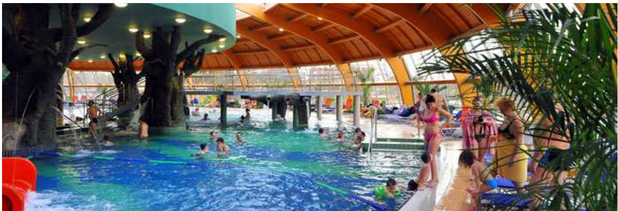
Le parc aquatique de Hajdúszoboszló

Des complexes entiers sont construits sur le thème de l'eau thermique, parfois ce sont carrément des petites villes qui se remplissent de touristes pendant l'été. Les touristes viennent très nombreux ; ce sont des Hongrois mais aussi des gens originaires de pays limitrophes, des Slovaques par exemple. Tous les grands spas et bains du pays offrent des piscines thermales, des piscines pour les loisirs ou toutes sortes d'espaces ludiques pour la famille. Le plus grand complexe balnéaire est situé à Hajdúszoboszló, en province. C'est typiquement une ville-complexe avec de nombreuses maisons secondaires à proximité. Le tourisme médical se développe aussi beaucoup, car de nouveaux soins sont aussi mis au point par les chercheurs hongrois dans ces stations thermales. Ces conditions, ainsi que les effets sur la santé des eaux thermales hongroises sont uniques au monde.