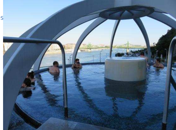
Les bains de Szechenyi

Des complexes entiers sont construits sur le thème de l'eau thermique, parfois ce sont carrément des petites villes qui se remplissent de touristes pendant l'été. Les touristes viennent très nombreux ; ce sont des Hongrois mais aussi des gens originaires de pays limitrophes, des Slovaques par exemple. Tous les grands spas et bains du pays offrent des piscines thermales, des piscines pour les loisirs ou toutes sortes d'espaces ludiques pour la famille. Le plus grand complexe balnéaire est situé à Hajdúszoboszló, en province. C'est typiquement une ville-complexe avec de nombreuses maisons secondaires à proximité. Le tourisme médical se développe aussi beaucoup, car de nouveaux soins sont aussi mis au point par les chercheurs hongrois dans ces stations thermales. Ces conditions, ainsi que les effets sur la santé des eaux thermales hongroises sont uniques au monde.